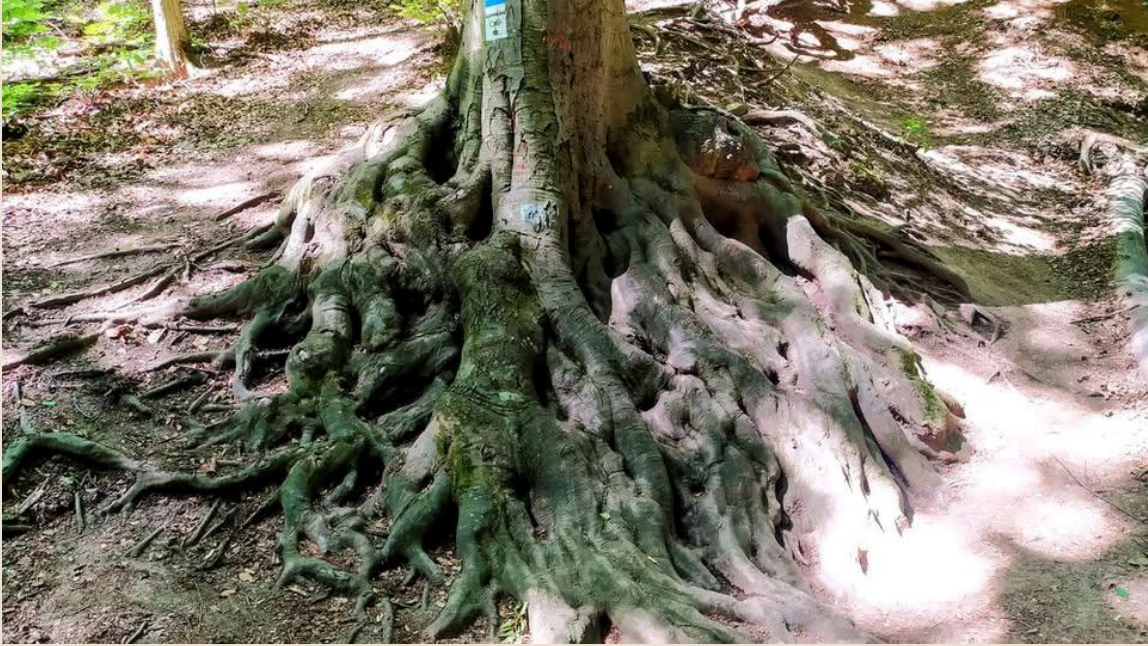
kép: a minap erdőben sétáltunk, és fennakadt rajt a szemem